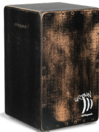
CP5230 Grunge Black

Playing surface: Old Red Textured design Body: 8 layers of birch 30 x 30 x 50 cm