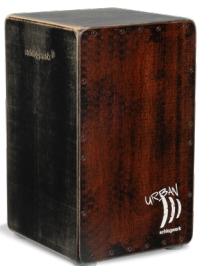
CP5210 Old Red Schlagfläche: Old Red Strukturschlagfläche Korpus: 8 Lagen Birke 30 x 30 x 50 cm