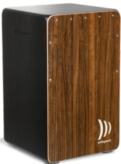
CP584 Super Agile Brown Sugar Schlagfläche: SC6 Ovangkol Furnier Korpus: 8 Lagen Birke 30 x 30 x 50 cm