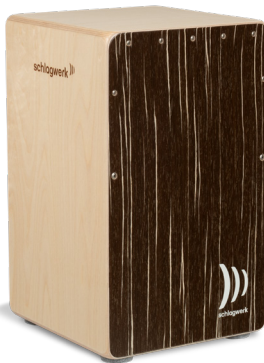
CP585 Super Agile Cappuccino Schlagfläche: SC6 Cappuccino Design Furnier Korpus: 8 Lagen Birke 30 x 30 x 50 cm