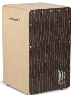
CP580 Super Agile Silver Lining Playing surface: Silver Lining design veneer Resonance Box: 8 layers of birch, approx. 30 x 30 x 50 cm