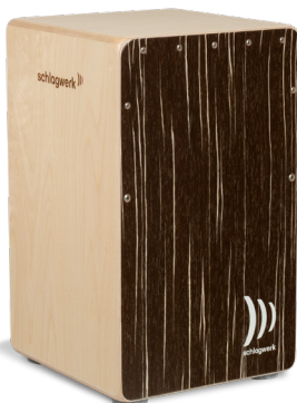
CP585 Super Agile Cappuccino Playing surface: Cappuccino design veneer Resonance Box: 8 layers of birch, approx. 30 x 30 x 50 cm