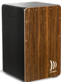
CP582 Super Agile Rustique Playing surface: Amazakoue design veneer Resonance Box: SPL approx. 30 x 30 x 50 cm